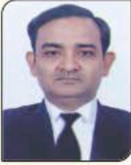
एड० पुनीत कंसल सदस्य